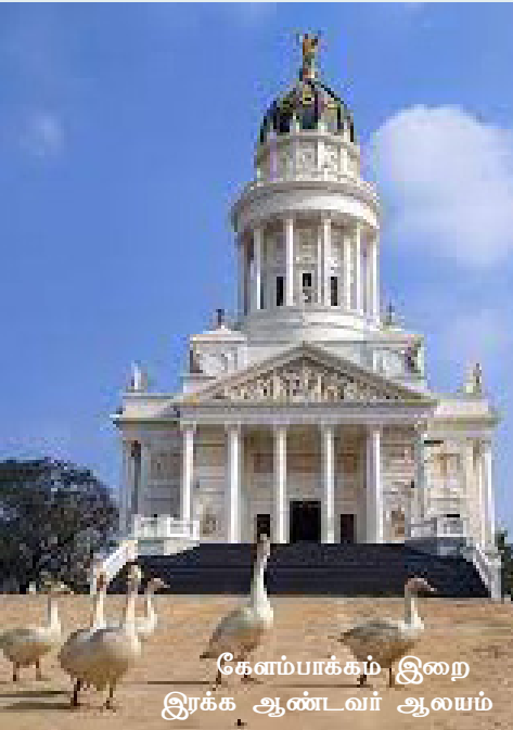
கேளம்பாக்கம் இறை இரக்க ஆண்டவர் ஆயம்

கடந்த பல வருடங்களாக எனது கடன் பிரச்சினைக்காகவும் நான் பல்வேறு பக்தி